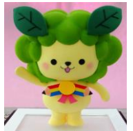
マスコット たまらん

そんな気持ちを玉ノ岡中学校に関わるすべての人に感じていただければ幸いです。今年度もコロナ禍でのスタートになります。手洗い、うがい、換気、黙食等予防の徹底に努めてまいります。保護者の皆様には急な変更等御迷惑をおかけすることもあると思います。それらも含めての教育活動に御理解と御協力いただけますようよろしくお願い申し上げます。