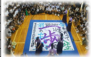
文化祭書道パフォーマンス